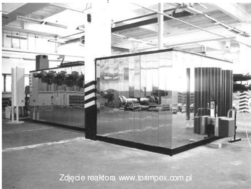
Zdjęcie reaktora

Charakteryzuje się niską energochłonnością i niewielką emisją wynikającą z wykorzystania odpadowej biomasy oraz pełnym wykorzystaniem odzyskanego wartościowego produktu energetycznego analogicznego z ropą naftową. Inwestycja proponowana przez firmę "RECYKLING CENTRUM S.C." ma charakter wybitnie ekologiczny a nowoczesność zastosowanych w niej rozwiązań spowoduje, że firma będzie prowadziła w oparciu o wykorzystanie technologii o znaczącym potencjale rynkowym i jest zgodna z kierunkami wskazanymi jako