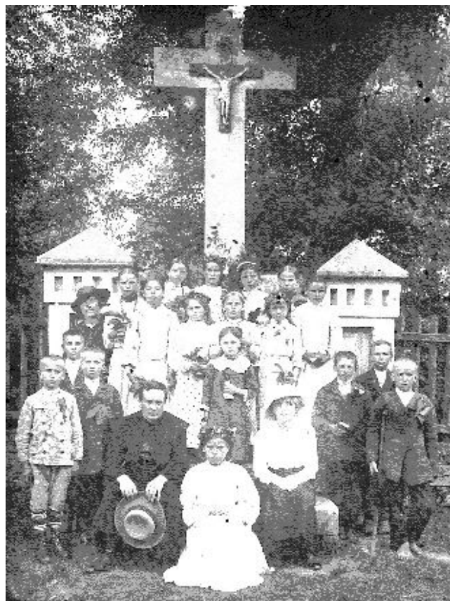
Zdjęcie przedstawia Dzieci Komunijne wraz z Nauczycielkami i Księdzem. Zostało zrobione w latach 1915-42 na tle Krzyża upamiętniającego okres Powstania Styczniowego. Jest to miejsce przy Kościele Parafialnym w Krzeszowie.