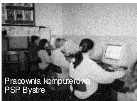
Pracownia komputerowa PSP Bystre

W minionym roku udało się zakupić 4 komputery do pracowni, wymienić część okien w salach lekcyjnych. Ogłoszono również przetarg na wykonanie dokumentacji technicznej w związku ze zmianą dachu nad budynkiem