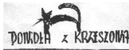
rys. H. Pisula

Upadek Krzeszowa w.. Spinoza z ulicy Rynkowej, przeł. Monika Adamczyk Garbowska, ATEXT, Gdańsk 1995