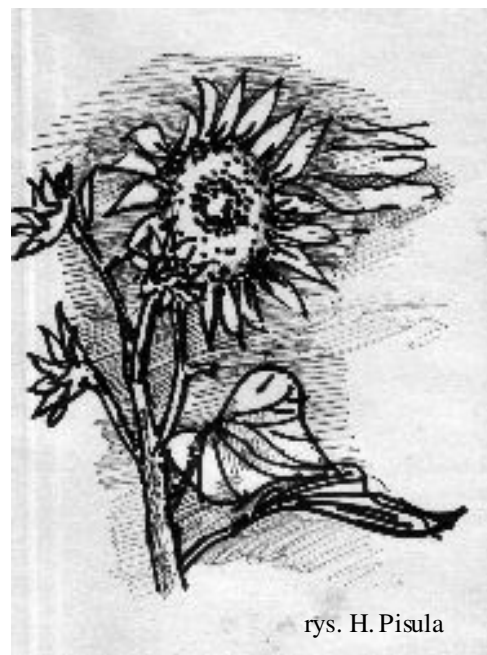
rys. H. Pisula