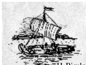
rys. H. Pisula

klas jest następująca (od najlepszej): III b, Ia, IIa, Ic, IIIa, Ib, IIc, IIb, IIIc. W szkole działa się bardzo wiele dobrze. Poszerzenie oferty dydaktyczno-wychowawczej szkoły stanowią realizowane dodatkowe programy, przeprowadzone apele o różnorodnej tematyce, nadawane audycje radiowe i okazjonalne