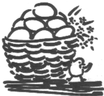
Rys. H. Pisula