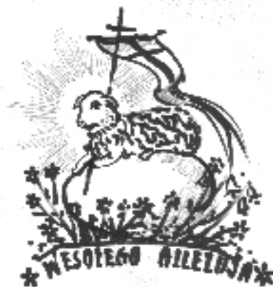
Rys. H. Pisula

W przypadku braku reakcji powiadom Policję