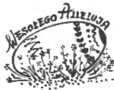
Rys. H. Pisula